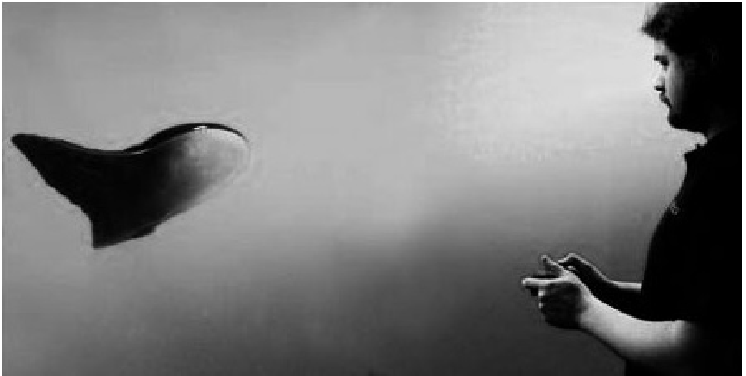
PUNKT 2008 Sparte Fotoserie Walter Fogel